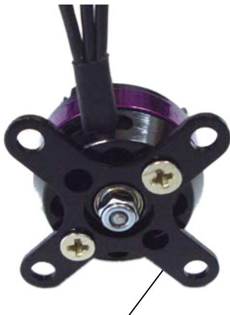
Rückwandbefestigung mit Alu-Stern Backmount with Alu-Star