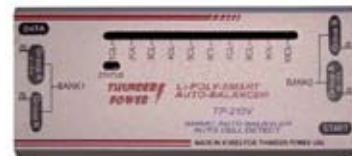
TP-210V (Balancer für 2-10 Zellen)