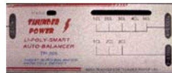
TP-205 (Balancer für 2-5 Zellen)

Hier werden keine Adapterkabel benötigt!