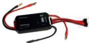
TP-210V (Balancer für 2-10 Zellen)