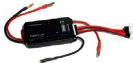
FP-V-Balancer (Balancer für 2-6 Zellen)